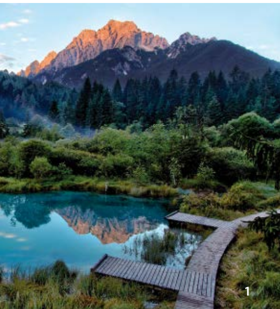
1 Zelenci, sorgente della Sava Dolinka