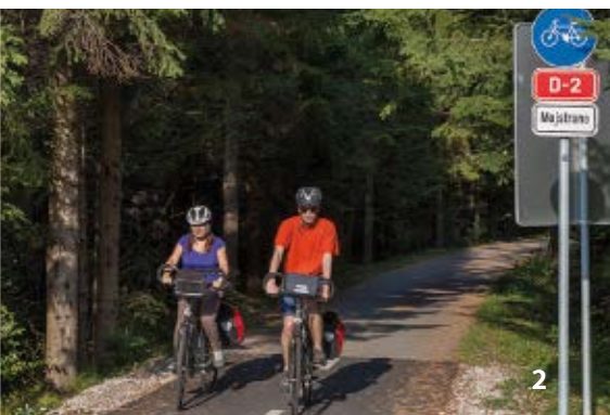
2 La foresta di Martuljek, pista ciclabile