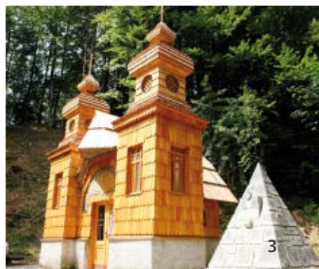
3 Kranjska Gora, la cappella russa sotto il passo di Vršč