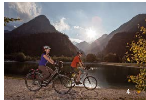
4 Kranjska Gora, lago Jasna